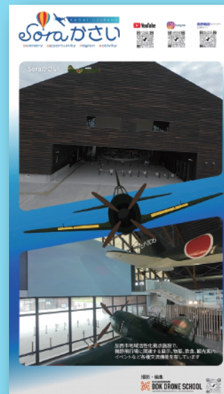
デジタルサイネージ用動画